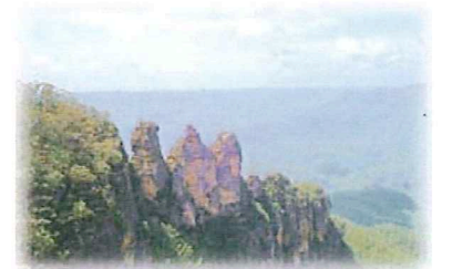
ブルーマウンテン(イメージ)