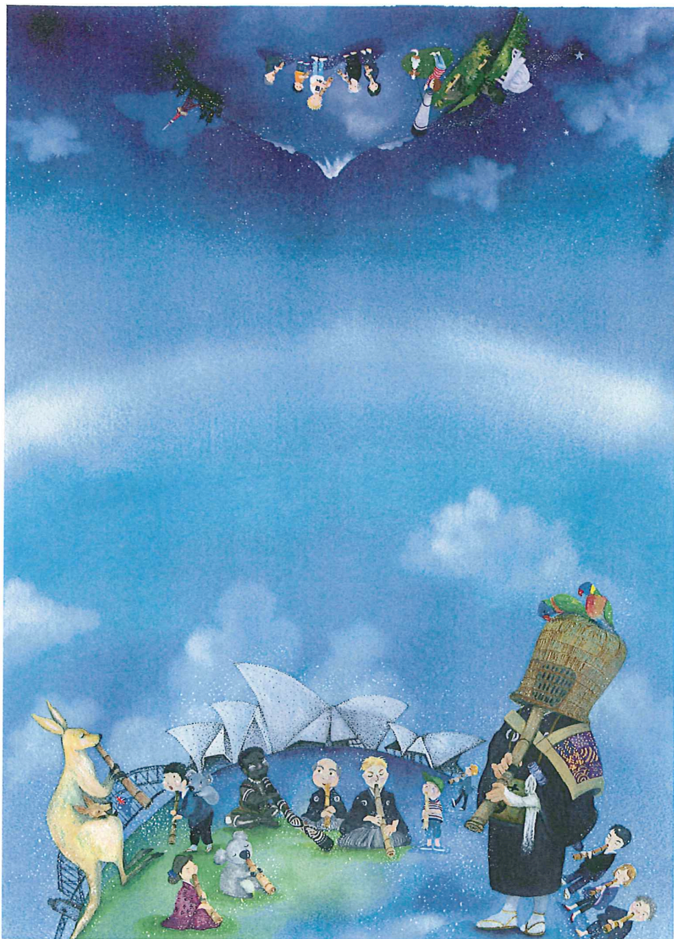
イラスト：横山 真希

国際尺八フェスティバル企画：(財) オーストラリア尺八協会 旅行企画・実施：(株)アサヒトラベルインターナショナル