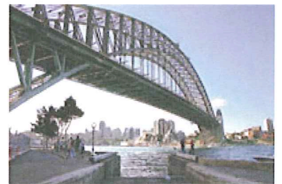
シドニー(イメージ)