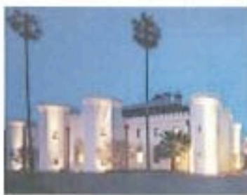
シドニー音楽芸術学校 (SCM)

今回のフェスティバルのメイン会場。シドニー・サークル・クウェーやロックスマヤシドニーオペラハウスの近くという最高のロケーション。施設も充実しており、最高の音響効果を持つ5つのコンサート会場があります。