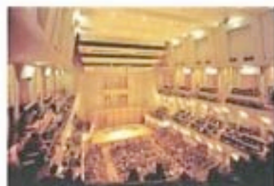
エンジェルブレイス シティリサイタルホール

利便性の高い場所にあり、素敵にデザインされたシティリサイタルホール。シドニーの歴史の中でもしっかり認知された素晴らしいホールです。