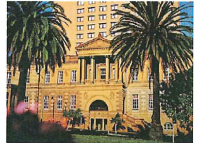
インターコンチネンタルホテル(イメージ)